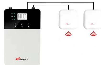
+ 2 antennes (l'antenne intégrée est désactivée) Couverture jusqu'à 1000 m 2