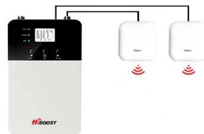
+ 2 antennes (l'antenne intégrée est désactivée) Couverture jusqu'à 1000 m 2