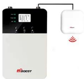
+ 1 antenne Couverture jusqu'à 800 m 2