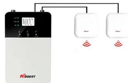
+ 2 antennes (l'antenne intégrée est désactivée) Couverture jusqu'à 1800 m 2