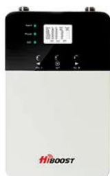
Kit Standard avec antenne Intégrée Couverture de 500 m 2 à 1000 m 2

Personnalisez votre solution d'amplification en fonction de vos besoins. Ajoutez jusqu'à 2 antennes panneaux ou omnidirectionnelles intérieures et doublez votre couverture sans splitter.