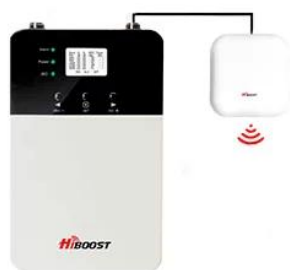
+ 1 antenne Couverture jusqu'à 1500 m 2