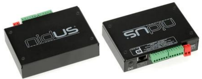
NIDUS-C & NIDUS-C plus

Équipé de plusieurs interfaces de communication (Ethernet, RS232, RS485), et capable de résister aux chocs, aux vibrations et aux températures extrêmes, il est conçu pour être utilisé dans des environnements industriels difficiles, ce qui le rend particulièrement utile pour garantir la conformité aux normes HACCP, et la surveillance des infrastructures critiques.